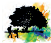
DIPUTACIÓN DE ALBACETE EDUCACIÓN, CULTURA, JUVENTUD Y DEPORTES

II Edición RUTAS DE SENDERISMO de la provincia de Albacete