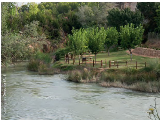
Fotografías Segovia (Ab)

subiremos hacia las cuestas de Mahora por estas sendas, a continuación cruzaremos el camino para de nuevo coger otra senda que atraviesa antiguos campos de cultivo en forma de terraza, esta senda nos llevará hasta un merendero municipal y de allí cruzaremos la carretera para llegar al parque fluvial de Valdeganga, en las inmediaciones de los puentes que cruzan el río, zona que sirve de descanso y de lugar de juego, habremos andado unos 14,5 kms.