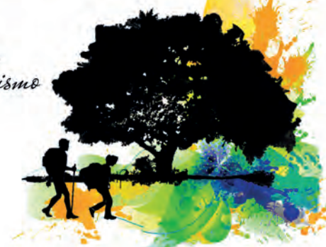
DIPUTACIÓN DE ALBACETE EDUCACIÓN, CULTURA, JUVENTUD Y DEPORTES

Vive el Deporte, el Turismo y la Cultura