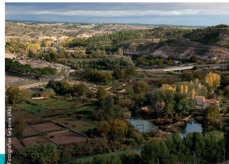
Fotografías Segovia (Ab)