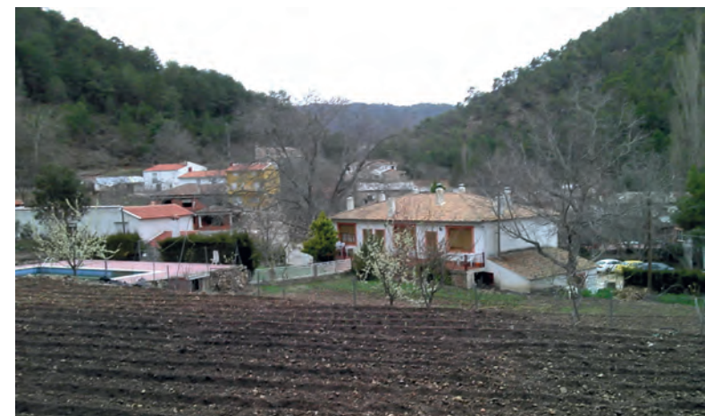
Batán del Puerto