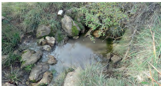
Fuente de los Palos

En seguida comienza a ascender. Ya en lo alto, a la derecha queda el Chorraero , un salto que hacen las aguas del arroyo. En breve llegamos a la Fuente de la Juanfría, de donde se abastece el pueblo de Paterna. Es un paraje encantador. La pista forestal se bifurca y habremos de seguir hacia la derecha. Cuando hemos recorrido cuatro kilómetros, llegamos a la Lagunilla (llamada así porque ocasionalmente se forma una pequeña laguna). También aquí se encuentra el Refugio de la Lagunilla, uno de los seis refugios integrados en la Red de Senderos Verdenace.