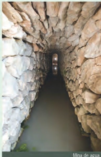
Mina de agua