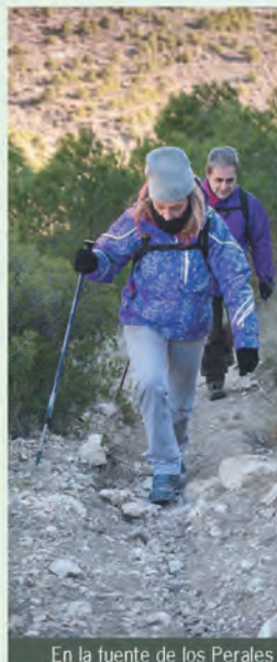
En la fuente de los Perales