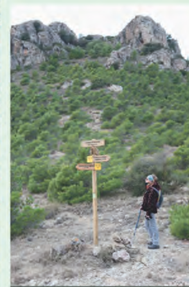
Señalización del sendero

Señalización de senderos de pequeño recorrido (PR)