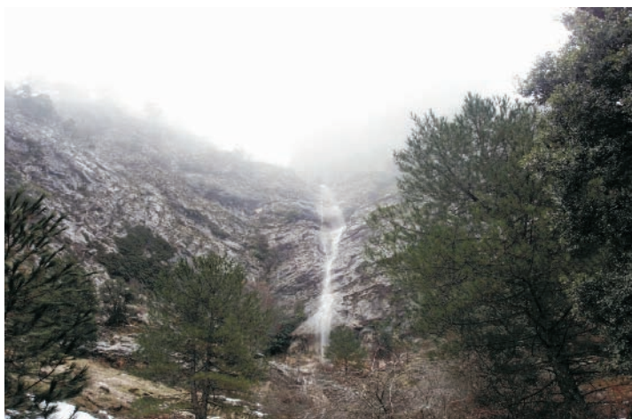
Chorrera de la Pileta

Para no caminar por la carretera utilizaremos la margen derecha del río de la Mesta para descender por el valle hasta el cortijo de Lázaro, aprovechando para atravesar ese pequeño museo de las formas de