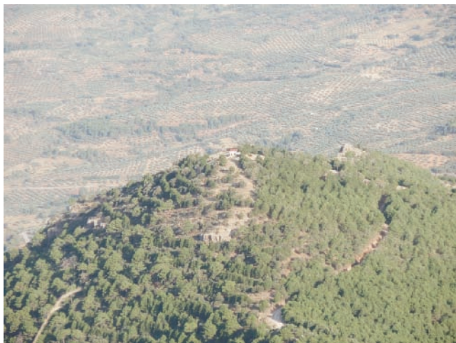
Caseta de vigilancia

Nos dirigiremos en autobús en dirección a Villaverde, y al rebasar el Km 9, giraremos a la izquierda dirección Sierra, continuando otros dos kilómetros hasta alcanzar el Puerto de la Sierra. Allí descenderemos y comenzará la ruta a pie. Si la visibilidad nos lo permite, desde el puerto podremos contemplar las primeras vistas sobre el valle del río Turruchel, el puerto del Bellotar y el valle del arroyo de los Avellanares.