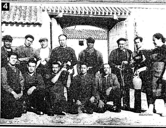
1. Las imágenes de labores agrícolas del pueblo son de las más características en la exposición. 2. En aquella época, la "mili" era una etapa obligatoria para todos los jóvenes. 3. Una instantánea de los alumnos de la escuela local. 4. Típica cuadrilla de trabajo de los años 50

blo, Banda de Música, Deportes y Festejos.