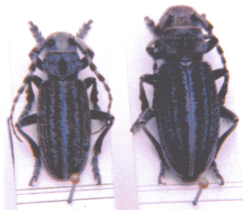
Macho y hembra de Iberodorcadion ( Baeticodorcadion ) mucidum (Dalma, 1817)