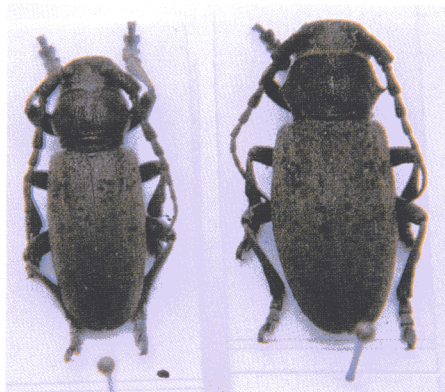
Macho y hembra de Iberodorcadion (Baeticodorcadion) nigrosparsum Verdu-go, 1993