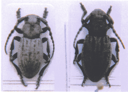
Macho y hembra de Iberodorcadion (Baeticodorcadion) marmottani (Escalera, 1900)