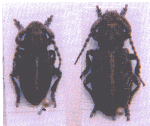
Macho y hembra de Iberodorcadion ( Baeticodorcadion ) suturale (Chevrolat, 1862)