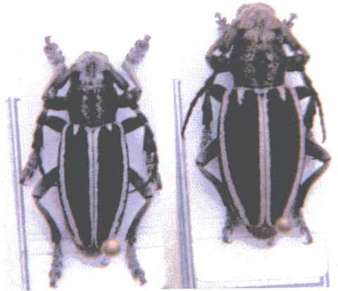
Macho y hembra de Iberodorcadion (Hispanodorcadion) fuentei (Pic, 1899)