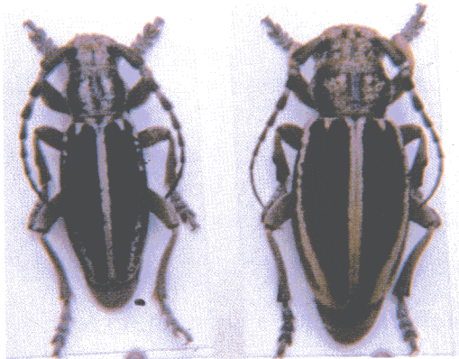
Macho y hembra de Iberodorcadion (Hispanodorcadion) bolivari