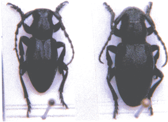
Macho y hembra de Iberodorcadion (Baeticodorcadion) iserni (Pérez Arcas, 1868)