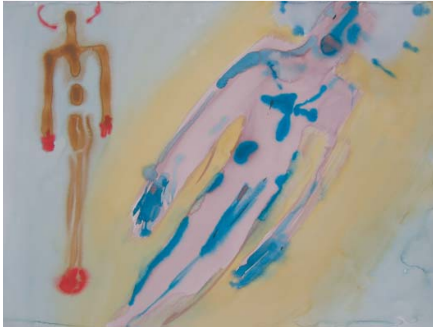
MADONNA Y PIETÁ . 2004. Acuarela sobre papel. 100 x 70 cm.