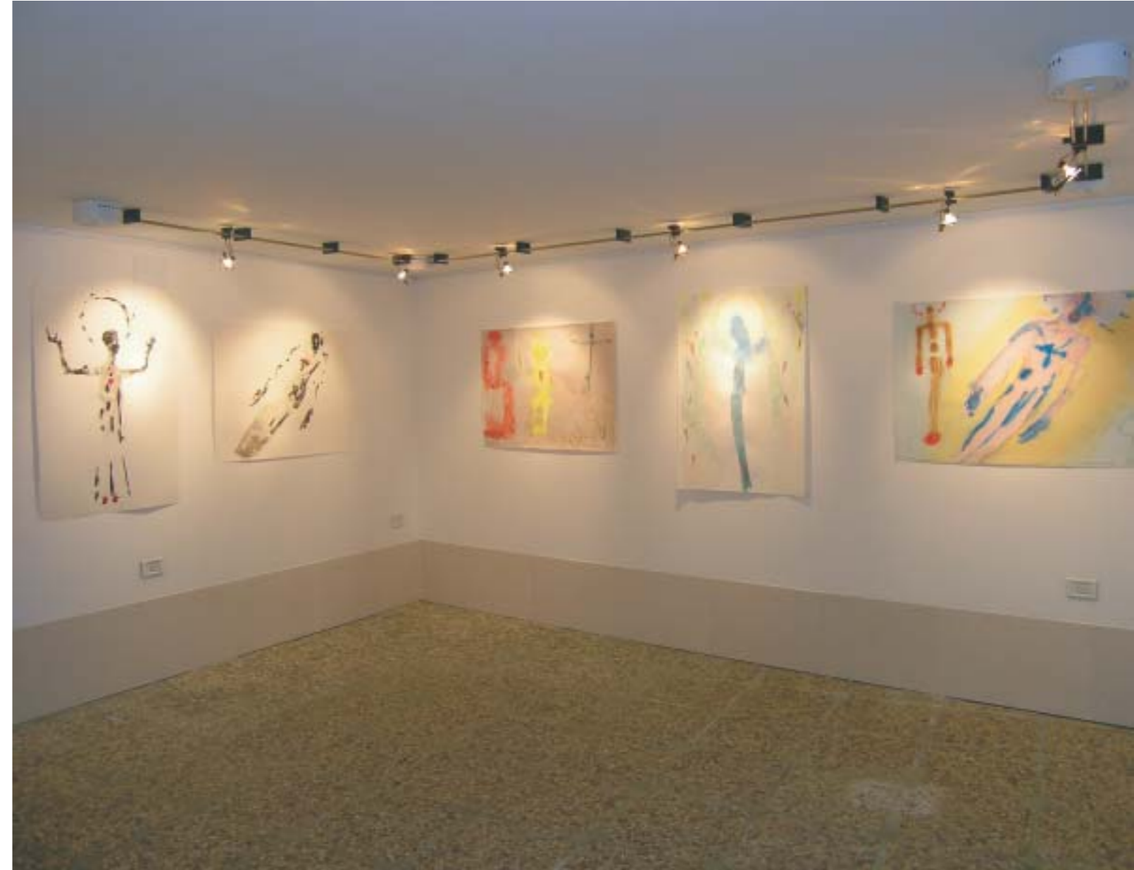
L'ASSUNTA ED IL CHRISTO (1, 2, 3, 4 y 5). 2004. Acuarela sobre papel. 100 x 70 cm.

Directora del Museo Arqueológico Nacional.