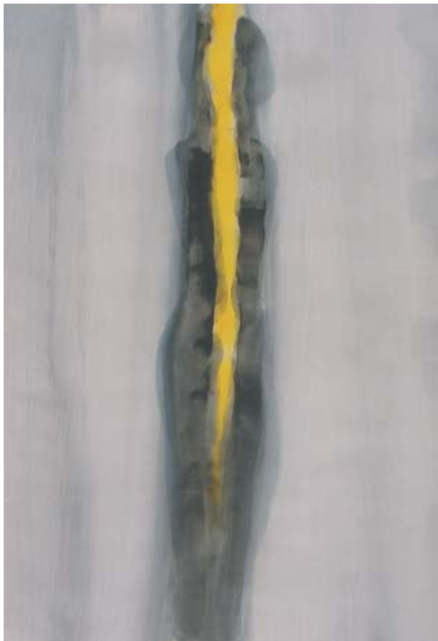
UNA LUZ . 2001. Tinta y acrílico sobre papel. 72 x 110 cm.