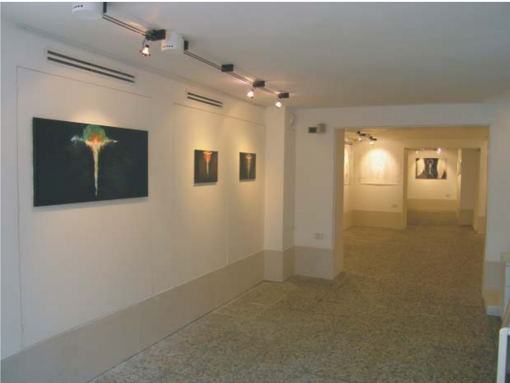
L'ASSUNTA ED IL CRISTO (1 y 2) . 2004. Bugno Art Gallery. Venecia.