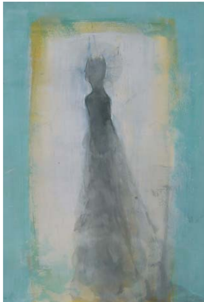
UNA LUZ . 2001. Tinta y acrílico sobre papel. 72 x 110 cm.