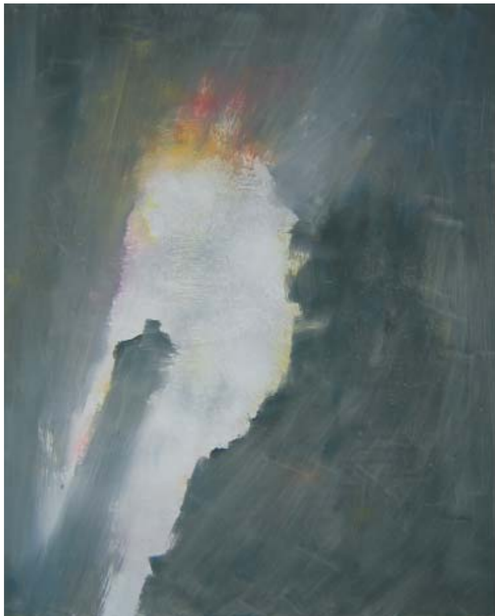
ÁNIMA . 2004. Óleo sobre tabla. 150 x 180 cm.