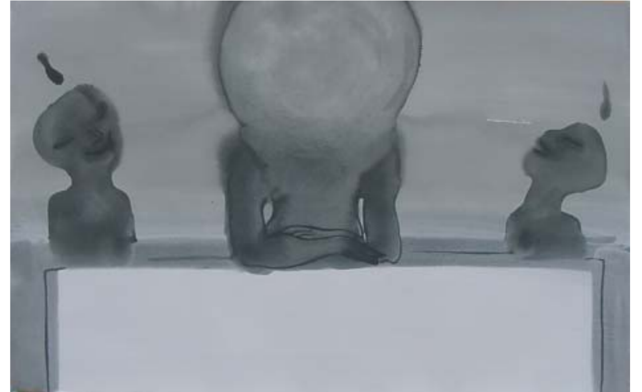
LAS MESAS . 2003. Tinta y acrílico sobre papel. 80 x 50 cm.