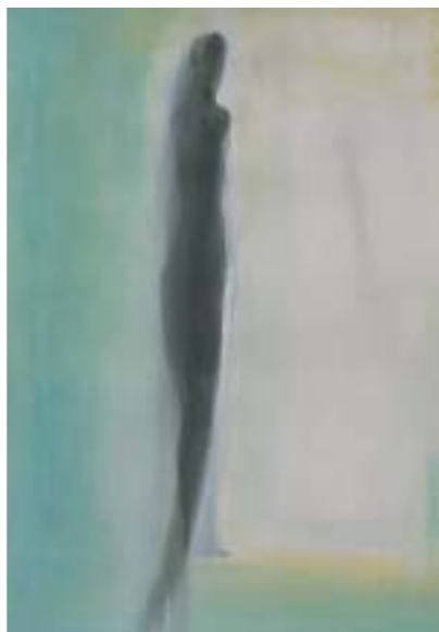
UNA LUZ (1, 2, 3 y 4). 2001. Tinta y acrílico sobre papel. 72 x 110 cm.

1996 A Project on Self Hate-Love, 20 mn., cortometraje en U-Matic.