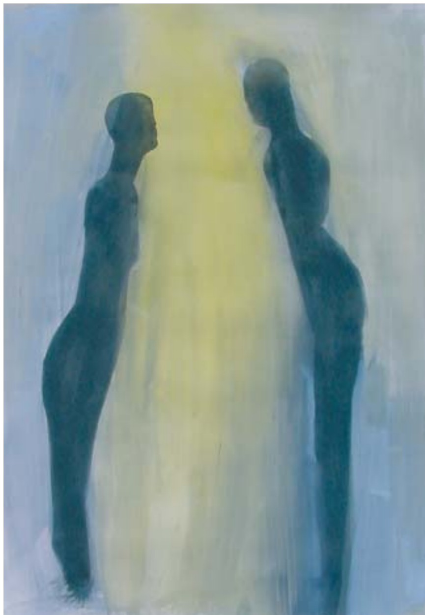
UNA LUZ. 2001. Tinta y acrílico sobre papel. 72 x 110 cm.