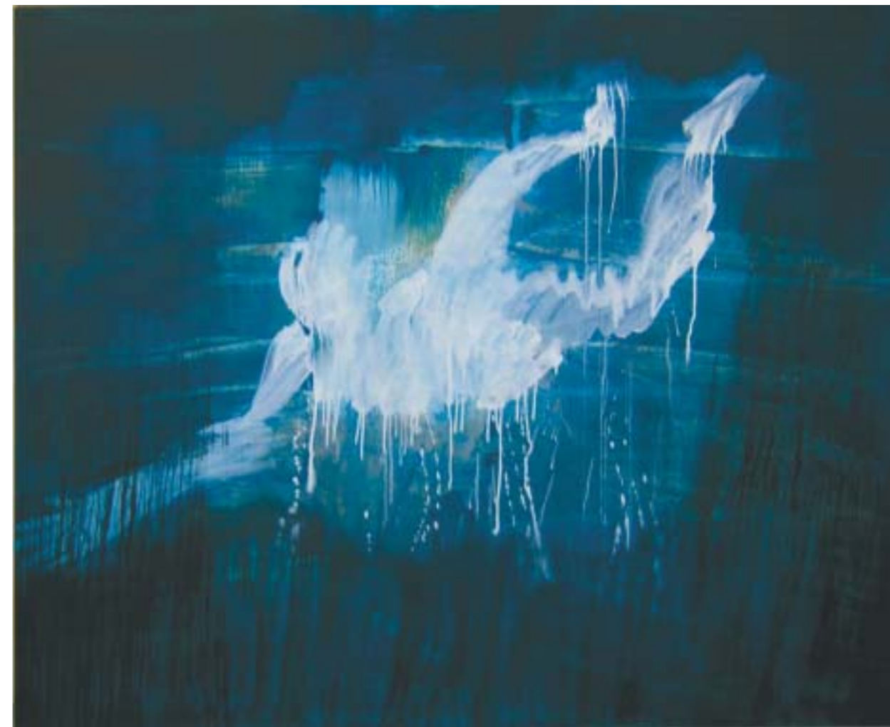
ÁNGEL . 2004. Óleo sobre tabla. 180 x 150 cm.