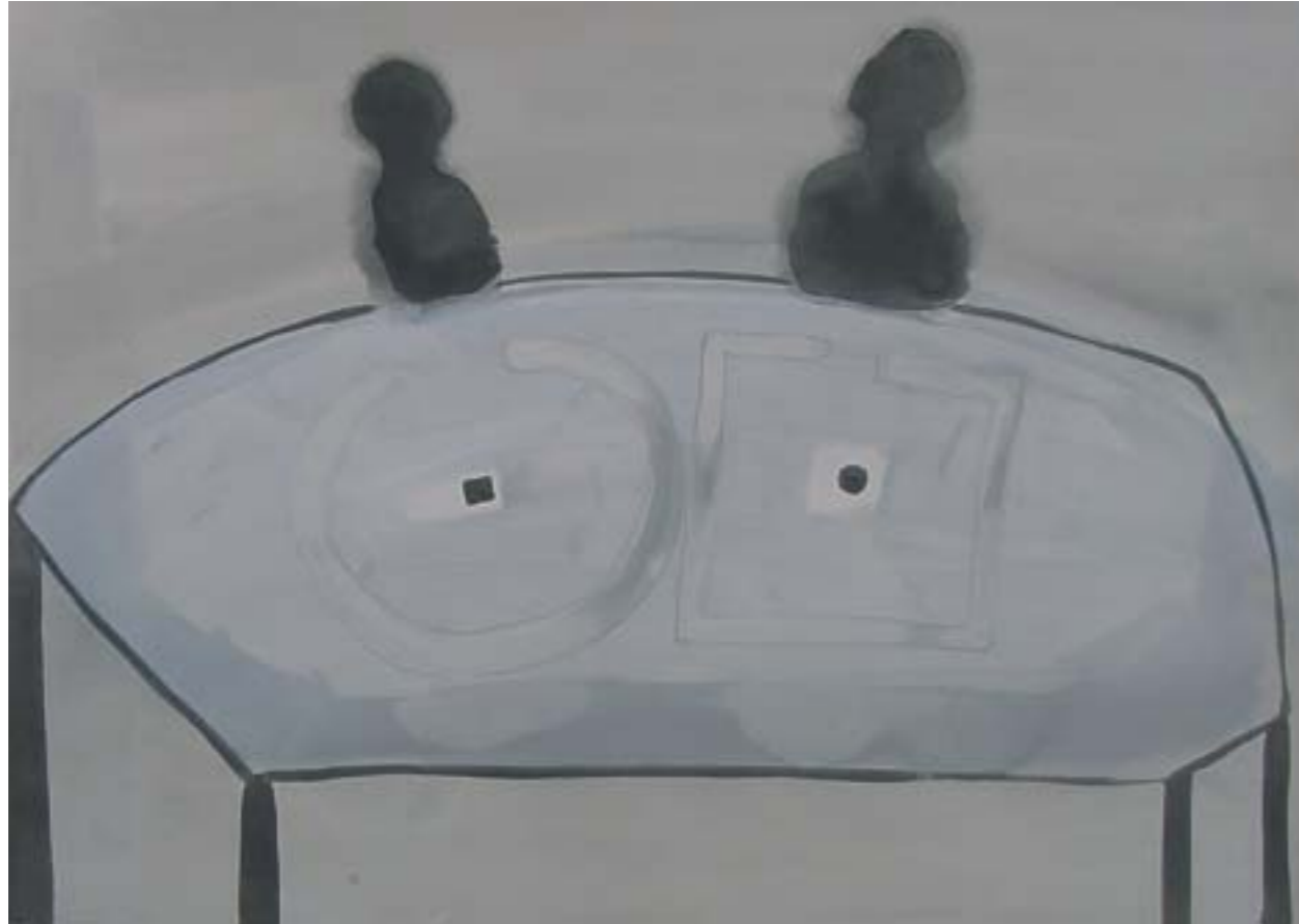
LAS MESAS . 2003. Tinta y acrílico sobre papel. 73 x 52 cm.