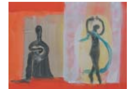
MIS MADRES (1, 2 y 3). 2001. Tinta y acrílico sobre papel. 50 x 50 cm. MISTERIOS (1, 2, 3, 4, 5 y 6). 2002. Tinta y acrílico sobre papel. 76 x 56 cm.