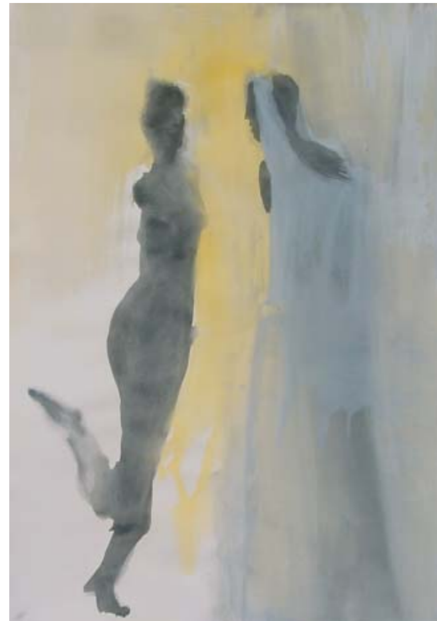
UNA LUZ . 2001. Tinta y acrílico sobre papel. 72 x 110 cm.