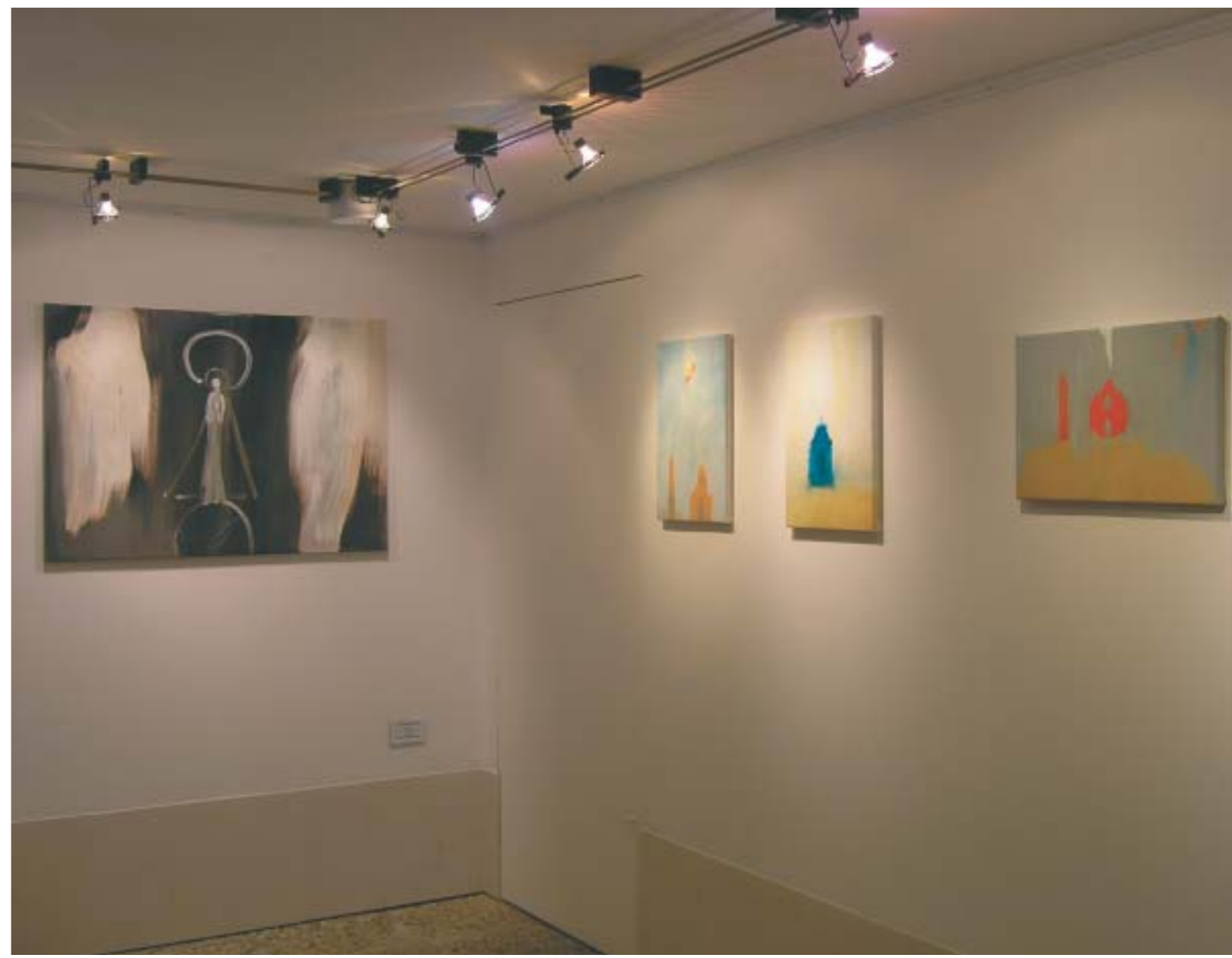
VIRGEN DE LOS LLANOS. Óleo sobre lienzo. 100 x 70 cm. ASSUNTA (1, 2 y 3). Óleo sobre lienzo. 30 x 45 cm.