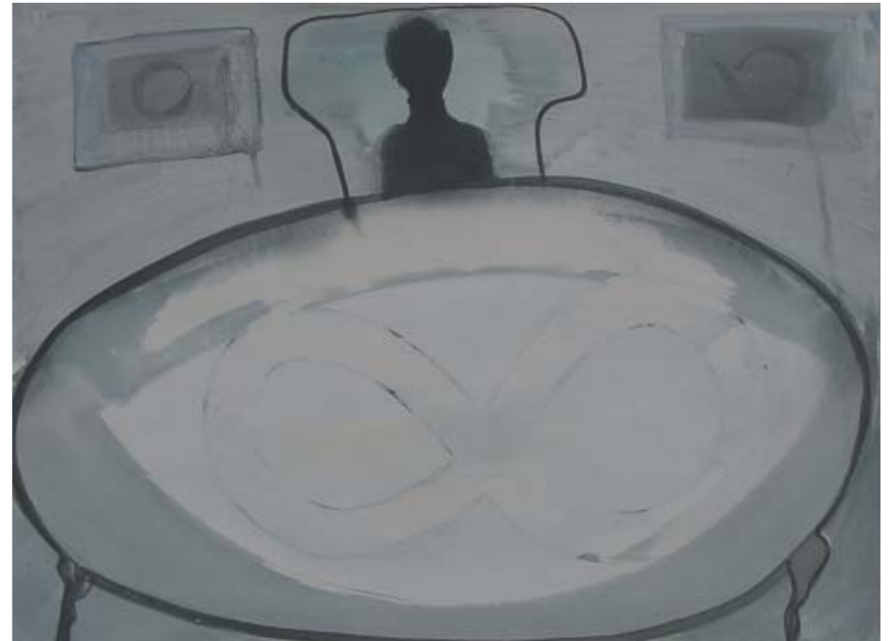
LAS MESAS . 2003. Tinta y acrílico sobre papel. 73 x 62 cm.