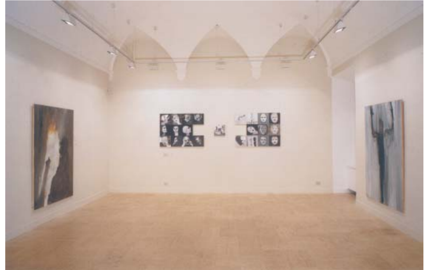
EL JUICIO . 2004. Academia de España en Roma.